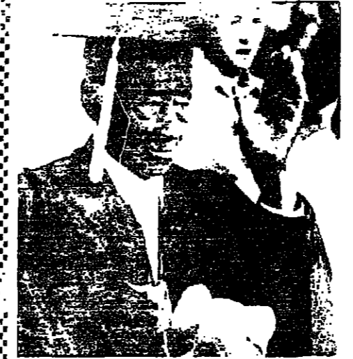
عمره ١٣٣ عاما وينال الشهادة الثانوية